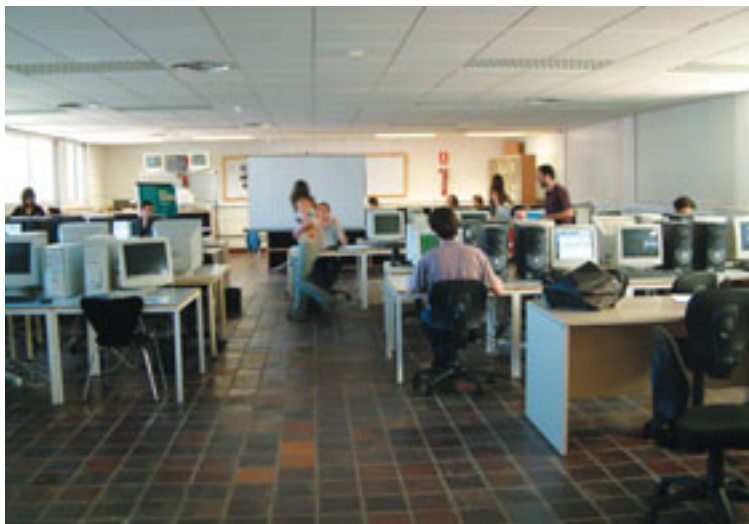
El Centro de Cálculo de alumnos de Astrofísica, uno de los más avanzados de la Universidad española. (Foto 43)