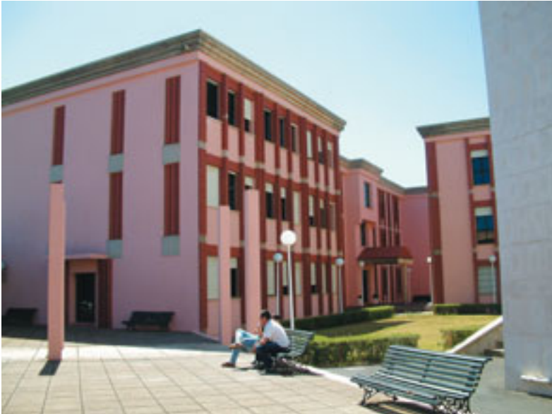
Los edificios calabaza en la actualidad, pintados de color rosado. (Foto 39)

adaptarse a la LRU, y siempre se estaba pensando, además, en la reforma de los planes de estudios. Al final, y en la actualidad, porque la cantidad de proyectos y trabajos que constantemente hay que gestionar se ha vuelto casi inabarcable.