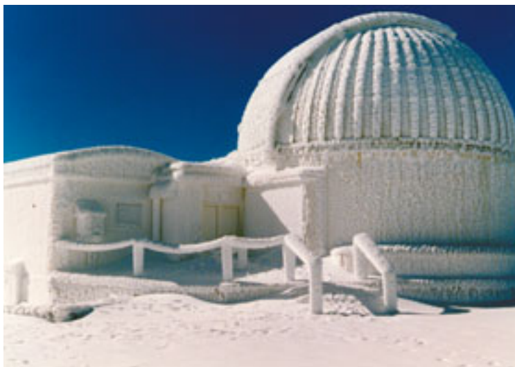
En las Islas Canarias también nieva. En la imagen se «ve» el telescopio Carlos Sánchez, en 1994. Las cumbres de los observatorios, dada su altitud, son testigo de ocasionales nevadas. (Foto 46)

Además, el cielo de las Islas Canarias supone una auténtica "reserva astronómica" mundial y una garantía de futuro. Después de un laborioso proceso, el 31 de