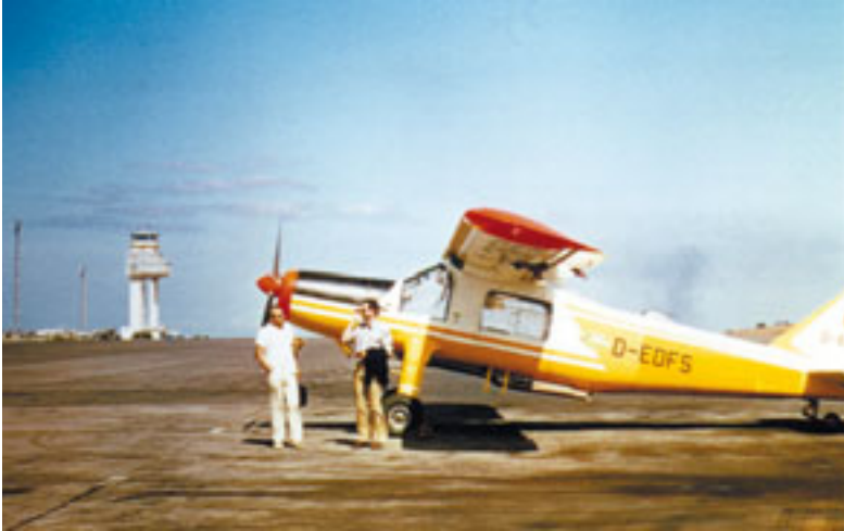
La avioneta alemana modelo DO-27 utilizada en la campaña de JOSO, en el aeropuerto de Los Rodeos (Tenerife), en junio de 1973. (Foto 21)