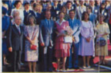
Reyes y presidentes de siete países europeos se dieron cita en suelo español para inaugurar el observatorio más importante del continente.

H ACE escasos días las Islas Canarias han sido el centro de atención mundial de la ciencia, convirtiéndose al archipiélago en la capital astronómica de Europa. Los Reyes de España, sus hijos, la reina Margarita de Dinamarca, el rey Carlos Gustavo de Suecia, la reina Beatrix de Holanda, el presidente de la República Federal de Alemania, el presidente de la República de Irlanda y el duque de Gloucester en representación de Reino Unido, asistieron al acto