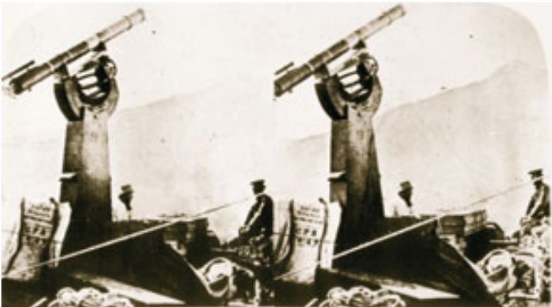
Charles Piazzi Smyth en Guajara, frente al Teide, junto a su telescopio. La foto está hecha para ser contemplada en relieve. (Foto 3)

Pero la historia contemporánea de la astronomía en Canarias se inicia en el siglo XIX y fundamentalmente con las expediciones de Charles Piazzi Smyth y Jean Mascart. La primera expedición genuinamente astronómica a las Islas Canarias fue la que realizó el escocés Piazzi Smyth en 1856. El 14 de julio, recién casado y acompañado por su esposa, inició su ascensión al Teide, y se instaló primero en Guajara (a 2.717 m) y más tarde en Altavista (a 3.250 m) y muy cerca del Pico (como se le denominaba en aquella época al Teide). El astrónomo trajo consigo dos grandes telescopios del observatorio de Greenwich, que desembarcaron en el puerto de La Orotava, y que tuvo que subir hasta su lugar de trabajo con la única ayuda de los habitantes del lugar y de unas mulas. Fue el primero que defendió la "astronomía de