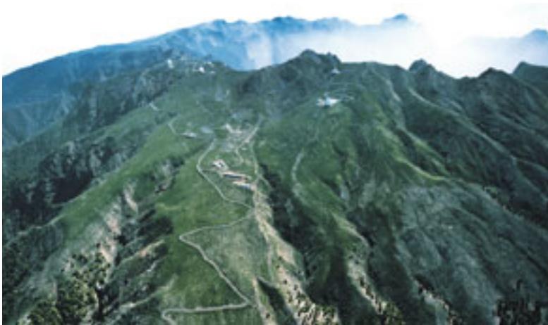
Vista aérea del Observatorio del Roque de los Muchachos, con el Gran Telescopio CANARIAS en primer término, a la derecha. La ausencia de contaminación atmosférica y lumínica de su cielo contribuyen a que sea considerado uno de los mejores observatorios del mundo. (Foto 48)