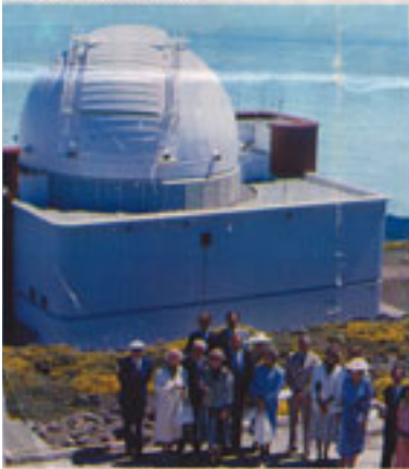
En El Roque de los Muchachos, a dos mil metros de altura, en la isla de La Palma, se han instalado dos observatorios.

Bajo un cielo limpio, con razón los cientí-