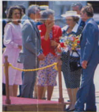
El fuerte viento levanta en la isla jugo matas pasadas a las monarcas europeas. Hubo levantamiento de faldas.