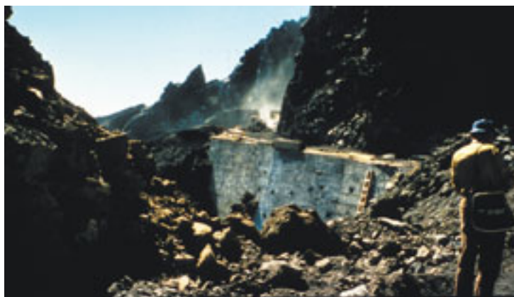
Obras de la carretera de acceso al Roque de los Muchachos. Se pueden ver las máquinas trabajando en el paso de los Andenes. (Foto 32)

Finalmente, el 26 de mayo de 1979, después de seis años de trabajosas negociaciones con las instituciones astronómicas de los países interesados (Dinamarca,