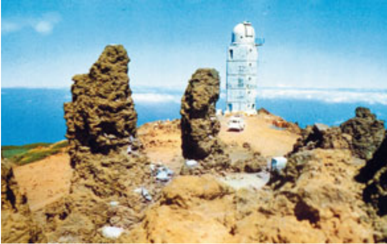
La antigua Torre Solar Alemana, llamada Benahoare. (Foto 24)

El primer momento de la instalación del primer telescopio en el Observatorio del Roque de los Muchachos, la Torre Solar Alemana, en 1978. (Foto 25)