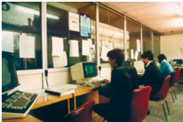
Centro de cálculo en uno de los barracones del IAC, a principios de los 80, con los terminales del ordenador MV/4000 de Data General. Éste sustituyó al Nova 4, y fue el primero que permitió disponer de varias pantallas a la vez. (Foto 29)

tigadora y de elaboración de datos; y otra sección de observatorios, ubicada en Las Cañadas del Teide y en La Caldera de Taburiente. “La relación entre la ULL y el IAC es fundamental”, subraya Francisco Sánchez. “De hecho, el embrión de lo que hoy es el IAC es el Observatorio del Teide”, que –recordemos– nació precisamente “bajo la inmediata dependencia del rector de la ULL”.