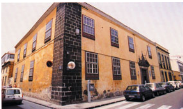
Casa colegio de la Compañía de Jesús, primera sede de la Universidad Literaria de San Fernando, en La Laguna. En la segunda planta funcionó la Facultad de Derecho, el rectorado, la secretaría y la biblioteca. En la primera se instaló la Facultad de Ciencias. (Foto 17)

en cuenta las peculiaridades de la ubicación ultraperiférica de la Isla. La desamortización de Mendizábal suprimió las rentas eclesiásticas con las que se financiaba, pero los ingresos obtenidos de las tasas académicas eran insuficientes, dada la escasez de alumnado en comparación con las universidades peninsulares. Estas dificultades, debidas sobre todo a la carencia de medios y de profesorado estable, llevaron a la Universidad –que tuvo que trasladar su sede al Convento de San Agustín por el progresivo aumento de sus alumnos– a una sucesión de órdenes de clausura y reapertura, que terminaron con su cierre definitivo en 1845.