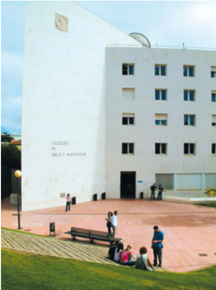
Fachada del edificio blanco de las Facultades de Física y Matemáticas. (Foto 41)

desde hace ya tiempo, y sin posibilidad de crecimiento, por la razón de que se ha centrado exclusivamente en los estudios de Astrofísica". También recuerda que al principio la Astrofísica (junto con el Instituto de Productos Naturales y Agrobiología) era lo único que había en la ULL en cuanto a investigación, pero en la actualidad