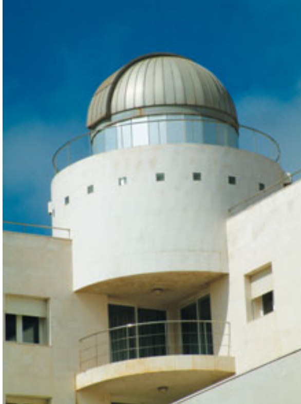
Cúpula del telescopio instalado en la azotea del Edificio Blanco de la Facultad de Física y Matemáticas. (Foto 40)

IAC-80 . Además, hay telescopios pequeños para prácticas que se utilizan al aire libre, tanto en la Facultad como en el Observatorio del Teide. El Mons es un telescopio totalmente manual, así que “para manejarse con él hay que conocerlo todo muy bien”.