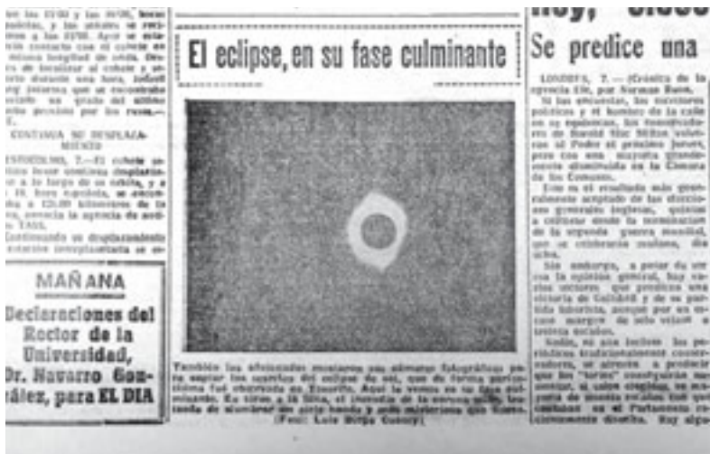
«En torno a la luna, el incendio de la corona solar, tratando de alumbrar un cielo herido y más misterioso que nunca». Recorte de la portada de El Día del jueves 8 de octubre de 1959. (Foto 11)

Tenerife el eclipse fue observado "de forma perfectísima" 2 . "El espectáculo fue verdaderamente impresionante, tanto en Santa Cruz como en toda la zona del nordeste, por la irisación polícroma de la corona de los astros superpuestos y la oscuridad nocturna que envolvió a la Tierra" 3 .