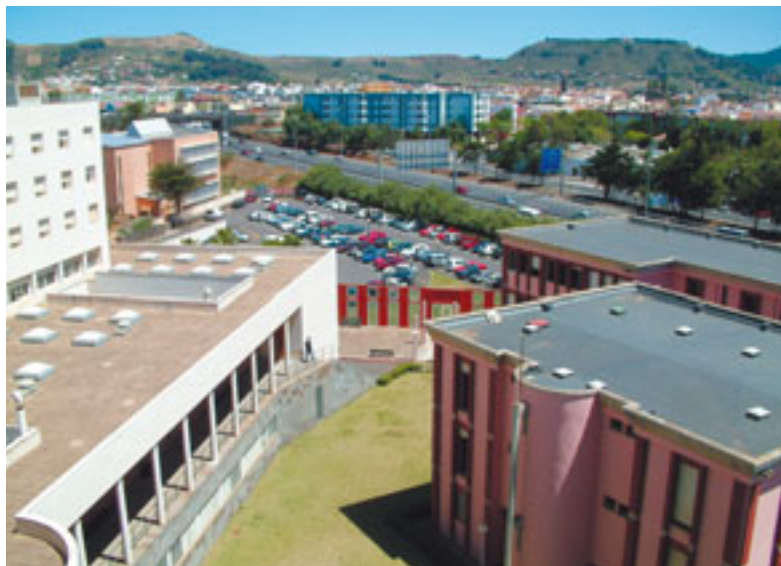
Vista desde la azotea del Edificio Blanco de las instalaciones de la Facultad de Física y Matemáticas, con la autopista al fondo. (Véase el contraste con la foto 28) (Foto 42)

consiguió acceder a la enseñanza de ninguna de las asignaturas troncales u obligatorias, y su participación en la Facultad quedó limitada a asignaturas optativas, fundamentalmente del segundo ciclo. Además, por supuesto, del tercer ciclo en Astrofísica.