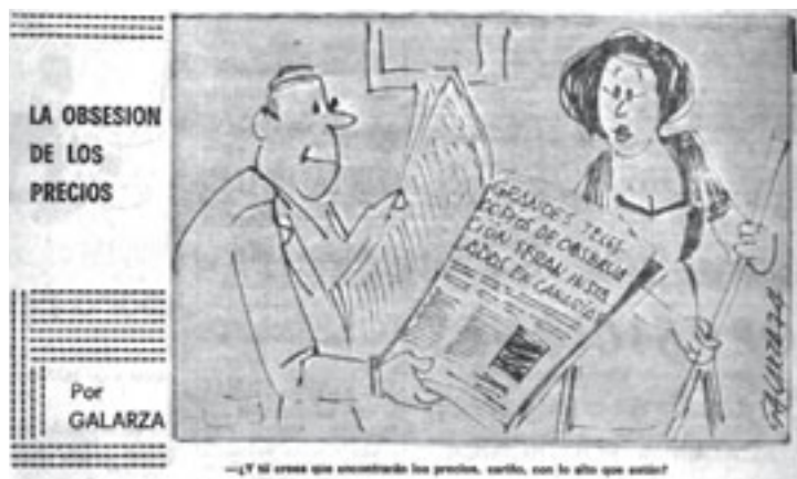
Chiste aparecido el 5 de diciembre de 1974 en el periódico El Día. (Foto 30)

Un equipo británico, bajo la dirección del Royal Observatory de Edimburgo, se había desplazado a Canarias en 1972 para estudiar el mejor lugar donde cons-