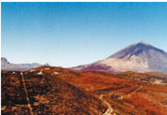
Imagen del Observatorio del Teide en el verano de 1971. Se distingue en primer término el Telescopio solar VNT con la Casa Solar. Detrás, las instalaciones de luz zodiacal y alta atmósfera. Y a la izquierda, el inicio de la construcción del edificio del telescopio infrarrojo de 1,5 m (después llamado Carlos Sánchez). (Foto 26)