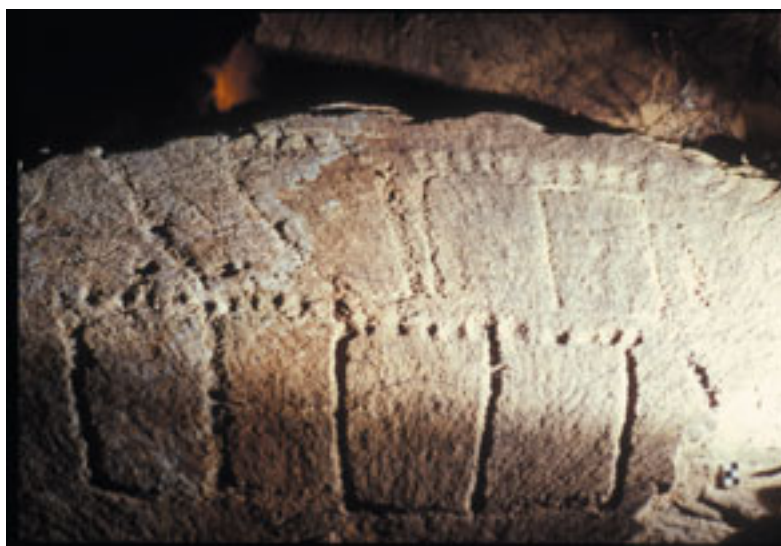
Podomorfos en la montaña de Tindaya (Fuerteventura). En esta zona existen más de 200 petroglifos podomorfos como éstos, la mayoría orientados en la dirección en que se pone el Sol en el solsticio de invierno. (Foto 2)

astronómicos entre los aborígenes. En los últimos años, y en colaboración con el Museo de la Ciencia y el Cosmos, el Museo Arqueológico de Tenerife y la Unidad de Patrimonio del Cabildo de Lanzarote, se han hallado marcadores y orientaciones astronómicas en la Degollada de Yeje en Tenerife, Cuatro Puertas y el Roque Bentaiga en Gran Canaria, o la Montaña de Tindaya en Fuerteventura, entre otros muchos lugares.