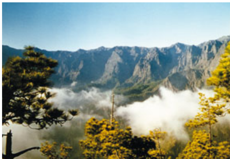
Vista del Roque de los Muchachos, tomada el 17 de junio de 1973 desde La Cumbrecita, antes de que se instalara el Observatorio y en su perfil se dibujaran también las siluetas de algunos telescopios. (Foto 23)

San Miguel de La Palma es la isla –entre todas las del globo– que alcanza en menor perímetro la mayor altura, culminando en los 2.423 m del Roque de los Muchachos. Este paraje no es un accidente destacado, sino la cima redondeada de un amplio sistema de pequeñas montañas distribuidas por los bordes de la caldera volcánica de hundimiento que constituye el Parque Nacional de la Caldera de Taburiente. Aunque fue el Observatorio del Teide el que acabó dedicándose preferentemente al estudio del Sol, con el tiempo, en el Observatorio del Roque de los Muchachos se llevarían a cabo muchas campañas solares, y en el propio Roque –es decir, el lugar geográfico más elevado– se llegó a construir, en 1978, una torre solar llamada Benahoare (el nombre en lengua aborigen de la isla de La Palma).