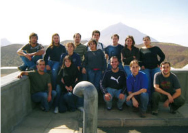
Algunos alumnos de la primera promoción del máster de Astrofísica de la Universidad de La Laguna con otros estudiantes en el Observatorio del Teide. (Foto 45)

que podían interesar a los alumnos". El postgrado está orientado en muchos casos a la investigación y el doctorado, pero puede ser también una opción de capacitación profesional para titulados universitarios dedicados a otras actividades. "Hicimos encuestas a los alumnos, y vimos que el perfil fundamental era muy vocacional, el de investigador. Pero para investigar también hace falta gente que sepa cómo utilizar un instrumento, cómo extraer los datos, cómo mejorar el software ...", explica Evencio Mediavilla. Por eso, los perfiles profesionales hacia los que se orientan se pueden resumir en los siguientes, aparte de investigador: experto en computación y teoría, experto en instrumentación y tecnología (que responderían a las dos especialidades que ofrece el máster), y profesor o divulgador. Este último perfil es una apuesta novedosa del máster, que incluye una asig-