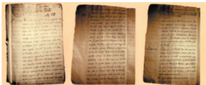
Copia del real decreto de Carlos IV de 11 de marzo de 1792. (Foto 16)

Francia, Inglaterra y Portugal, así como la rivalidad con Gran Canaria –el llamado “pleito insular”–, habían frustrado su efectivo establecimiento. Tras la restauración borbónica, un nuevo Real Decreto, de Fernando VII, ratifica en 1816 la ubicación en la ciudad de La Laguna de la universidad, que por fin ve la luz.