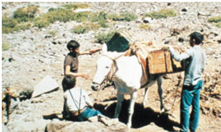
En la construcción del Observatorio del Roque de los Muchachos también hizo falta utilizar mulos como medio de transporte, igual que ocurría en la época de las primeras expediciones científicas en las Islas. (Foto 31)