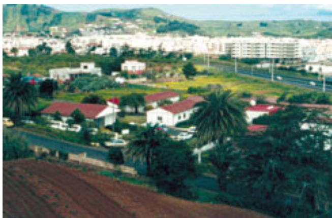
Los antiguos barracones del IAC, junto a la carretera de la Esperanza, entre la autopista y la actual avenida Astrofísico Francisco Sánchez. (Foto 28)