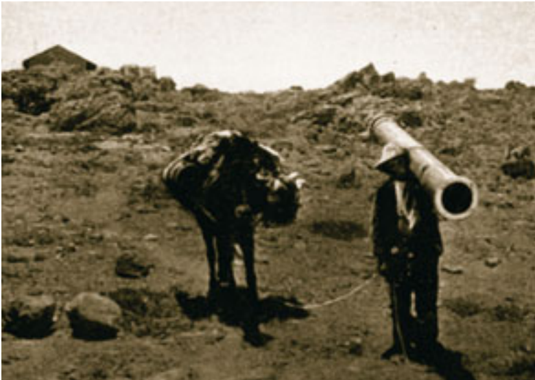
Un arriero en las cañadas del Teide con el tubo del telescopio de Mascart al hombro. O como dice el propio Mascart: «Nuestro amigo Feliciano, poniendo en evidencia a sus indolentes compañeros, lleva al hombro el tubo de aluminio del ecuatorial». (Foto 8)

Para ello, levantaron un campamento en la montaña de Guajara, la cima más alta después del Teide, en el mismo lugar donde Piazzzi Smyth había llevado a cabo sus valiosos estudios de espectroscopía en 1856. Mascart quedó tan satisfecho de las condiciones de observación que ofrecía el lugar, que propuso la construcción de un observatorio intencional en Guajara. De hecho, fue el primer intento formal de crear un observatorio de este tipo en Canarias, y probablemente lo hubiera consigui-