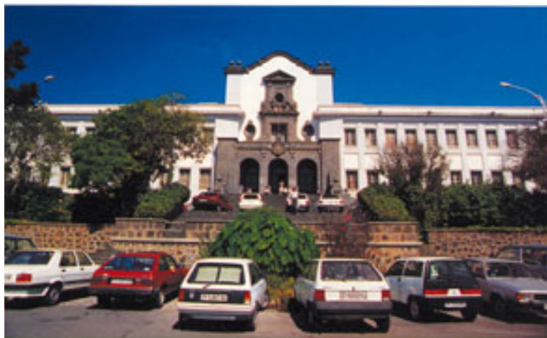
Universidad nueva. Desde 1960, albergó las facultades de Derecho y Ciencias. (Foto 18)

De todas maneras, en 1960 se inauguró en su totalidad el nuevo edificio de la Universidad, localizado en el actual campus central, que en ese momento albergó las facultades de Derecho y Ciencias, la biblioteca general, el rectorado y las secretarías.