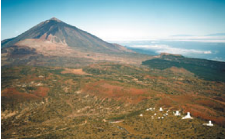
Vista aérea del Observatorio del Teide, con el imponente volcán de fondo, y el contorno de la isla de La Palma asomando tras el mar de nubes. Este observatorio posee la mayor colección de telescopios e instrumentos solares del mundo. (Foto 47)