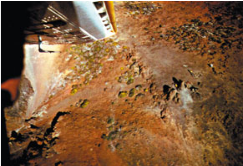
Una pasada de la avioneta de JOSO sobre el Roque de los Muchachos, en junio de 1973. En la imagen se pueden apreciar los sensores (de temperatura, humedad,...) acoplados bajo las alas. (Foto 22)