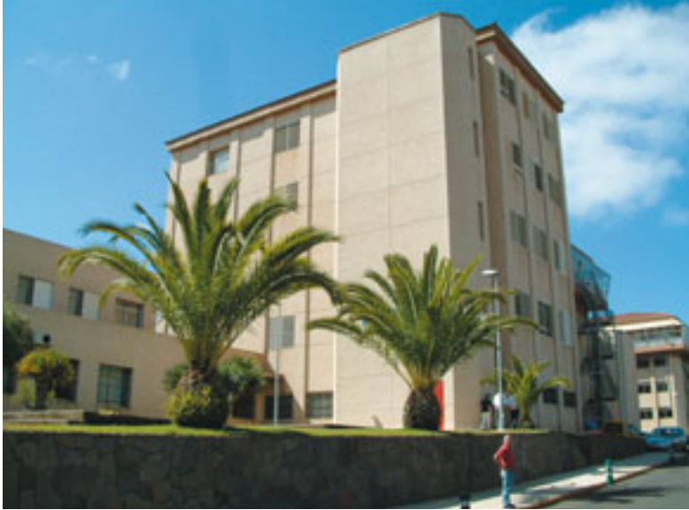
Una de las torres de la Facultad de Biológicas, en la actualidad. Las clases de Astrofísica se trasladaron en 1985, de forma temporal, a la quinta planta. (Foto 36)

del curso 86/87 ambos cursos, 4º y 5º, se trasladarían al llamado "edificio calabaza".