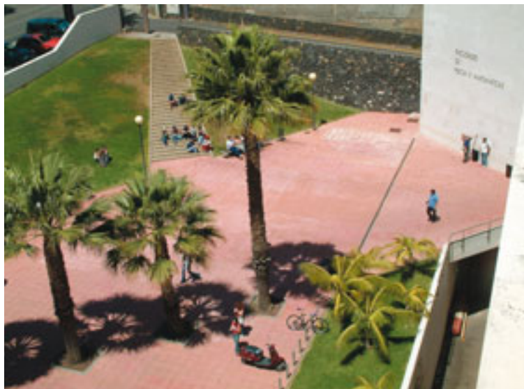
Explanada de entrada del Edificio Blanco. (Foto 44)

más trabajo personal de los alumnos, se iban a transformar radicalmente los estudios de postgrado en España. Los programas de doctorado actuales, los DEA (Diploma de Estudios Avanzados), desaparecerán y se convertirán en máster. En el año 2010, que es el plazo fijado para culminar la adaptación, “de los cerca de 2.400 programas de doctorado que había en todo el país no quedarán más de 400 ó 500 –calcula Ramón J. García López–, lo que implica que serán los que tengan la mención de calidad los que podrán pasar a ser máster oficial”. Por ejemplo, de los 36 programas de doctorado que tenía la Universidad de La Laguna antes de la reforma, en 2007 se estaban impartiendo 12 programas oficiales de postgrado (compuestos de máster y doctorado) diseñados bajo las nuevas condiciones de la Unión Europea.