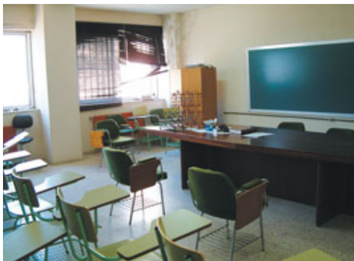
Una de las aulas del Departamento de Edafología donde se impartieron las primeras clases de la licenciatura. En la actualidad muestra un cierto abandono. (Foto 35)