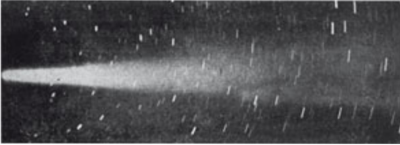
Ampliación de una fotografía del cometa Halley tomada en Tenerife el 7 de mayo de 1910. (Foto 9)

sobre Tenerife en particular es ayudar al desarrollo de un turismo instructivo y lleno de encanto. Del mismo modo, es colaborar en la creación de un importante centro de estudios en este lugar. Ésta es la mejor recompensa que podríamos obtener de nuestros esfuerzos, pues tenemos la íntima convicción de que sería hacer un gran favor a la causa del progreso de las ciencias de observación”.